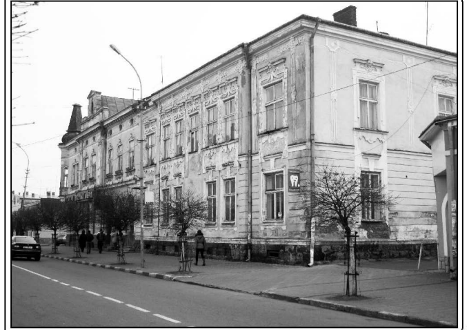
Архітектурний ансамбль міста.