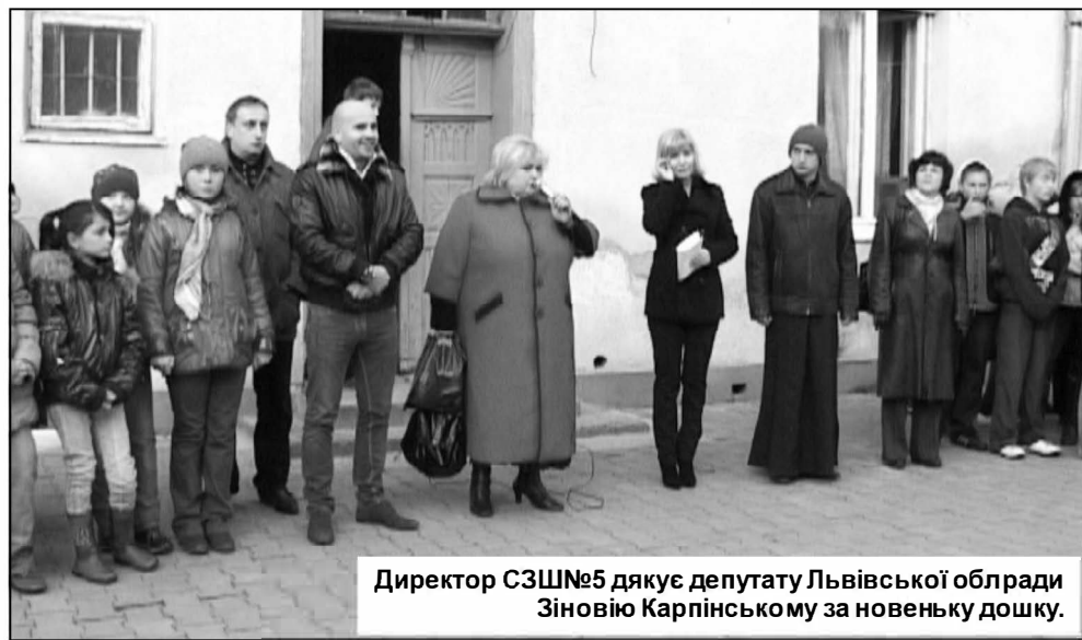
Директор СЗШ№5 дякує депутату Львівської облради Зіновію Карпінському за новеньку дошку.